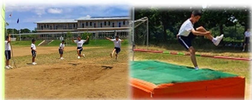
陸上の授業の様子