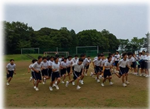
暑さに負けず、1500m走に挑む