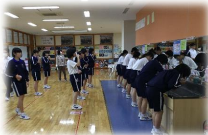
ソーシャルディスタンスを保ち歯磨き